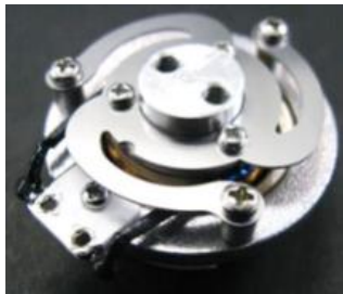
【開発した加振器ユニット】

オンキヨー株式会社は、OEM 事業において、加振器を用いた高品質な音声/音楽再生を可能にする技術やノウハウを活用し、今後 AI、IoT 対応が進むと予想される家電や住宅用建材などの新規事業分野に向けたソリューションの提案を開始いたしました。