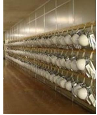
全従業員への防災ヘルメット、リュック配布