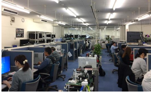
鳥取コールセンター 災害時にコールセンターのリソース を活用

当社グループでは、従業員の安全と事業の安定的な継続のための対策を十分に実施し、従業員をはじめとするステークホルダーとともに、経営理念「VALUE CREATION」を実現してまいります。