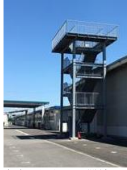
津波に備えた避難棟設置