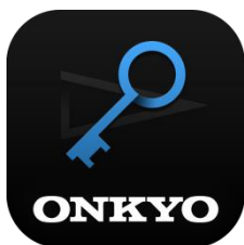
【HD プレーヤーパック】