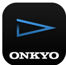
【Onkyo HF Player】

ハイレゾ音楽プレーヤーアプリや DAP(デジタルオーディオプレーヤー)カテゴリーにおいてユーザーの皆様よりさまざまなご意見を頂き反映することで、機能性と利便性をさらに高め、使いやすさの向上を図っております。