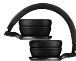
折り畳みイメージ