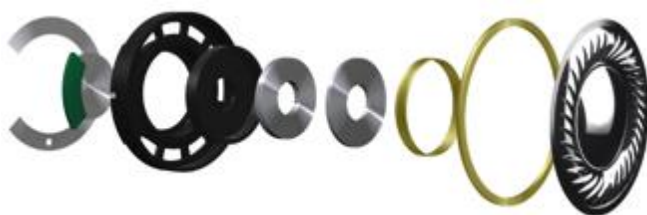
大口径40mmドライバーイメージ

ハウジング外部にチャンバー(空気室)を搭載することで、レスポンスの良い低域再生と外部の騒音に対する遮音性能を高めています。また、ハウジングのフロント容積を増やし重低音と空気感を出すことで、クラブフロアにいるような臨場感ある音づくりをしています。