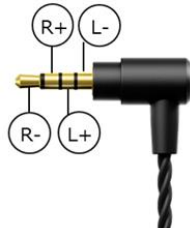
【φ2.5mmL 型 4 極 バランス プラグ】

オーディオ信号専用に設計するとともに、再生機との接続用に φ2.5mmL 型 4 極 バランス プラグを採用しており、パイオニアブランドの DAP「XDP-300」やデジタルミュージックプレーヤー「XDP-20」をはじめとする φ2.5mmL 型 4 極 バランス 端子を装備した再生機と「SE-CH9T-K」のバランス接続ができます。チャンネルセパレーションに優れたバランス接続により、ハイレゾ音源の特長である音の解像度、広がりなどをより感じられる高音質再生を楽しめます。