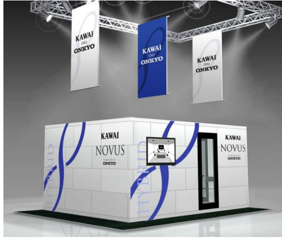
共同ブースイメージ

同イベントにおける河合楽器との共同ブースにおいては、「NOVUS NV10」のデモンストレーションを実施すると共に、当社コンセプトオーディオアンプ、河合楽器のピアノ塗装を施したコンセプトスピーカーも展示を行い、NOVUS NV10のピアノサウンドと共に河合楽器と当社の技術と音の知見が融合したサウンドを紹介する予定をしております。