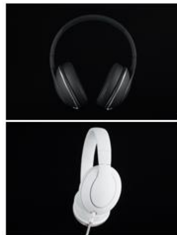
音楽プロデューサーの ZEDD とこの度製品化したヘッドホン (ブラック、ホワイト)