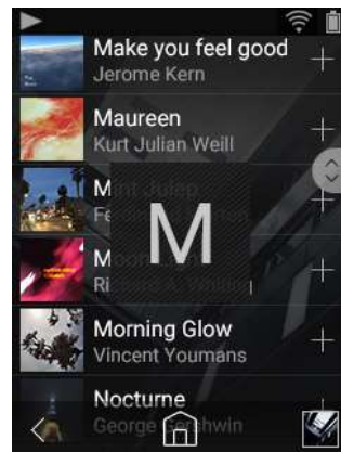
(インデックス表示を追)