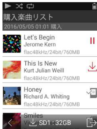
(e-onkyo music ダウンローダー)