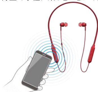
【NFC 機能搭載の Bluetooth®対応機器と簡単接続】

NFC 機能を搭載した Bluetooth®対応のスマートフォンや携帯電話、DAP などを本機にかざすだけで簡単に接続ができるので、保存した楽曲などをワイヤレス再生で手軽に楽しむことができます。