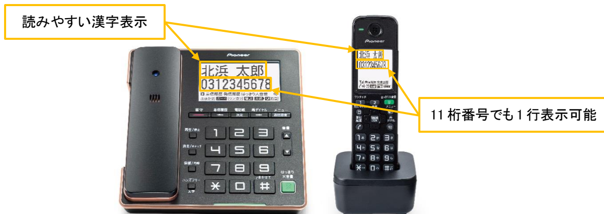
【大型液晶画面(親機・子機)】

黒を基調とするシンプルで質感の高いデザインを採用することで、さまざまなインテリアに調和します。読みやすい漢字表示に加え、視認性の高いホワイトバックライトを採用した大型液晶画面を搭載しており、親機(3.9型)、子機(2.1型)ともに見やすく、携帯電話の電話番号(11桁)も1行で表示できるなど、使いやすい仕様になっています。